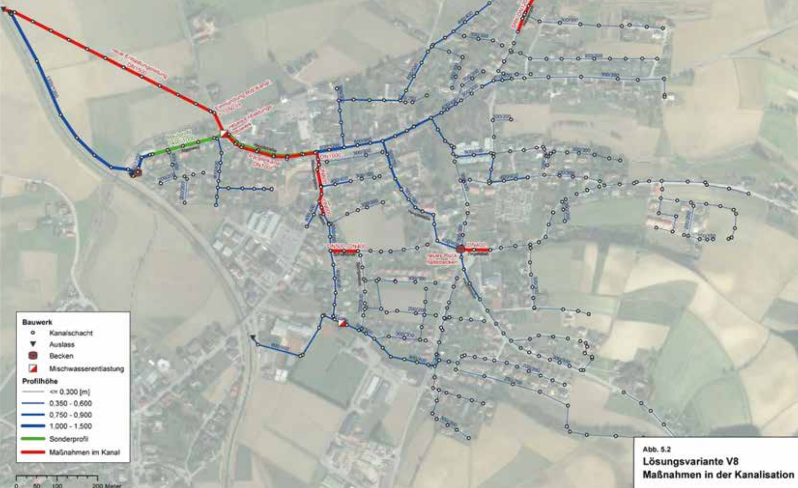
Abb. 5.2 Lösungsvariante V8 Maßnahmen in der Kanalisation