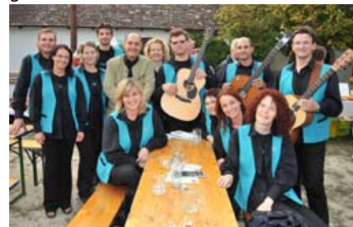
LH Stv. Wolfgang Sobotka und die Chameleons

Im Rahmen des NÖ-Chöre-Treffens im Museumsdorf Niedersulz gaben die Chameleons - das Vocalensemble aus St. Leonhard am Forst - wiederum deren Bestes. Mit viel Schwung und guter Laune begleiteten sie die Ausstellung im Museumsdorf. Sie sorgten nicht nur beim offiziellen Teil auf der Bühne für gute Laune - sondern auch beim gemütlichen Ausklang der Veranstaltung. Auch LH Stv. Wolfgang Sobotka war von der Darbietung der Chameleons begeistert.