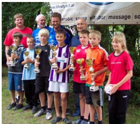
Sieger des Kinder-Fußballturniers