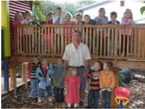
Abschluss nach der Sanierung der roten Gruppe mit den heimischen Professionisten.