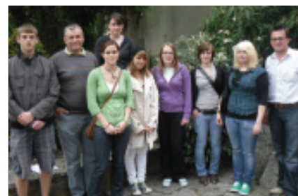
von links nach rechts:

Bereits in den Vorjahren gab es Projektarbeiten mit den verschiedensten Themen. Im Vorjahr wurde erstmals eine Jugendzeitung herausgegeben, die sehr großen Anklang fand. Daher entschied man sich wieder, eine Jugendzeitung mit aktuellen Themen zu veröffentlichen.