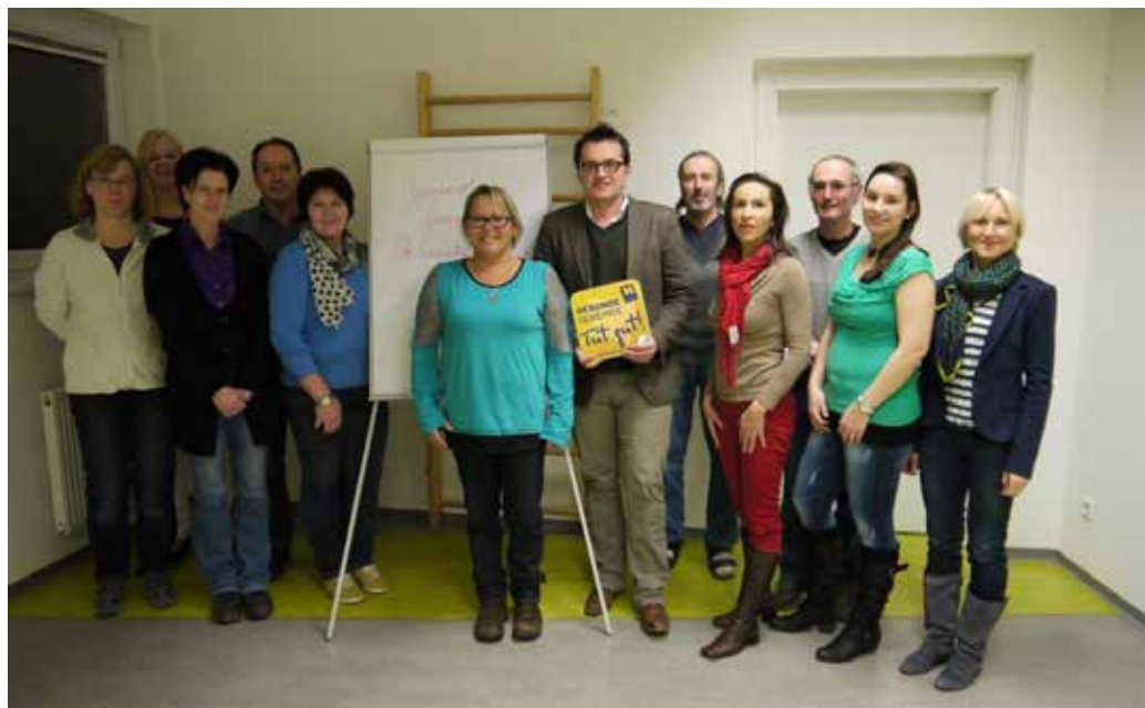
von links nach rechts:

sammen. Von Babymassage, über Erste Hilfe Kurse, Bauchtanz, Kochen und Backen mit Kindern bis hin zu Vorträgen und Workshops rund um das Thema Gesundheit ist für jeden etwas dabei.