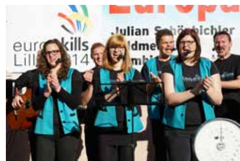
Chamelons-Auftritt mit CD-Präsentation