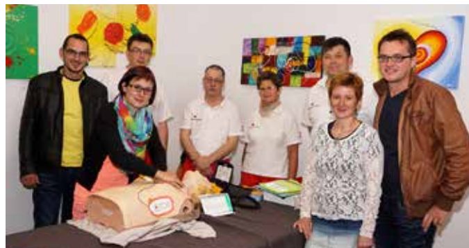
Foto rechts: Mitarbeiter des Roten Kreuzes stellten in Ihrer Infoecke den Laiendefinierten Interessierten sowie den Gemeindevertretern vor.

Die Gesundheitsinitiative „Tut gut!“ betreute die Veranstaltung mit einem Info-Stand und stellte Küchenexperimente und verschiedene Fitness-Geräte zum Ausprobieren zur Verfügung.