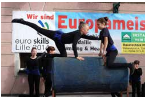
Voltiervorführung von Stutenmilchhof Gallist