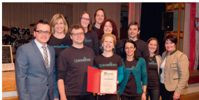
Chameleons (30-jähriges Vereinsjubiläum)