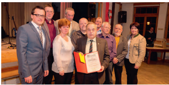
Wanderverein Großweichelbach (40-jähriges Vereinsjubiläum)