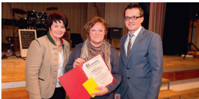
SPÖ Frauen (20-jähriges Jubiläum des Silvestermarktes)