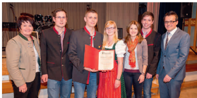
Landjugend Leonhofen (Umsetzung der Idee „Generationenpark“)