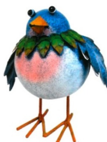
Auszeichnung: Vogel, blau mit Federn, Höhe: 13 cm